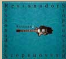
Ressonadors. 20 d'agost. 22h.