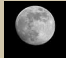
S'Arenal Dance 27 d'agost. 22 h.