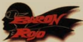
Barón Rojo. 14 d'agost. 22h.