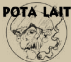
Pota Lait. 21 d'agost. 22h.