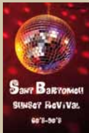
Sant Bartomeu Sunset Revival 13 d'agost. 22h.